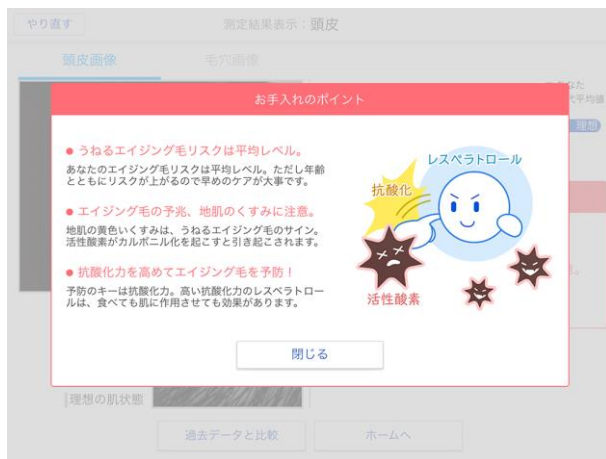
項目毎アドバイス例