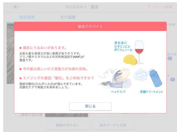
総合アドバイス例